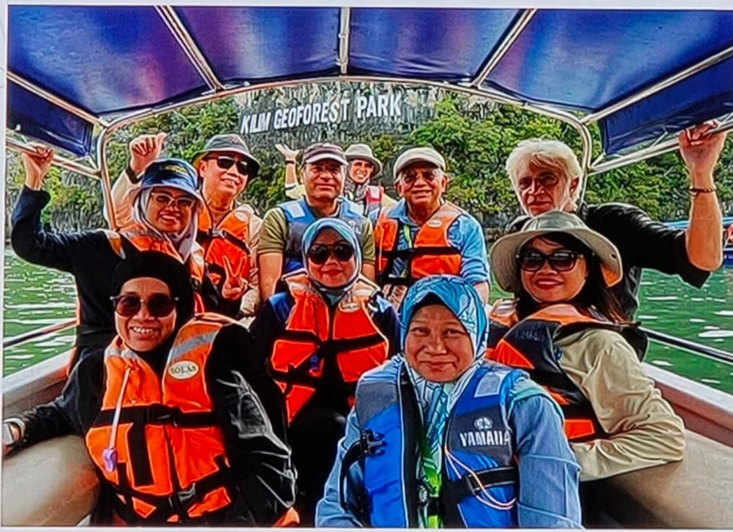
Lawatan pembelajaran geotrail KILIM Geoforest Park, Langkawi

Menyokong Industri Kecil dan Sederhana (IKS) yang menumpukan kepada penambahbaikan dan kecekapan perniagaan;