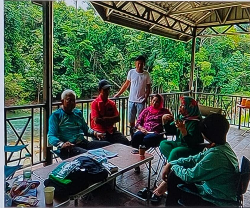
Perbincangan dengan Ahli Parlimen berkenaan pembangunan Ekorimba Lubuk Yu, Pahang