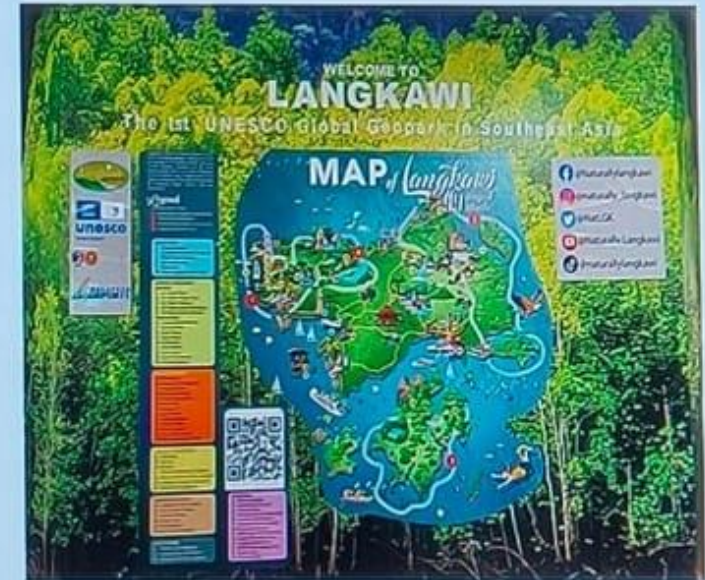
Papan tanda di Lapangan Terbang, Langkawi