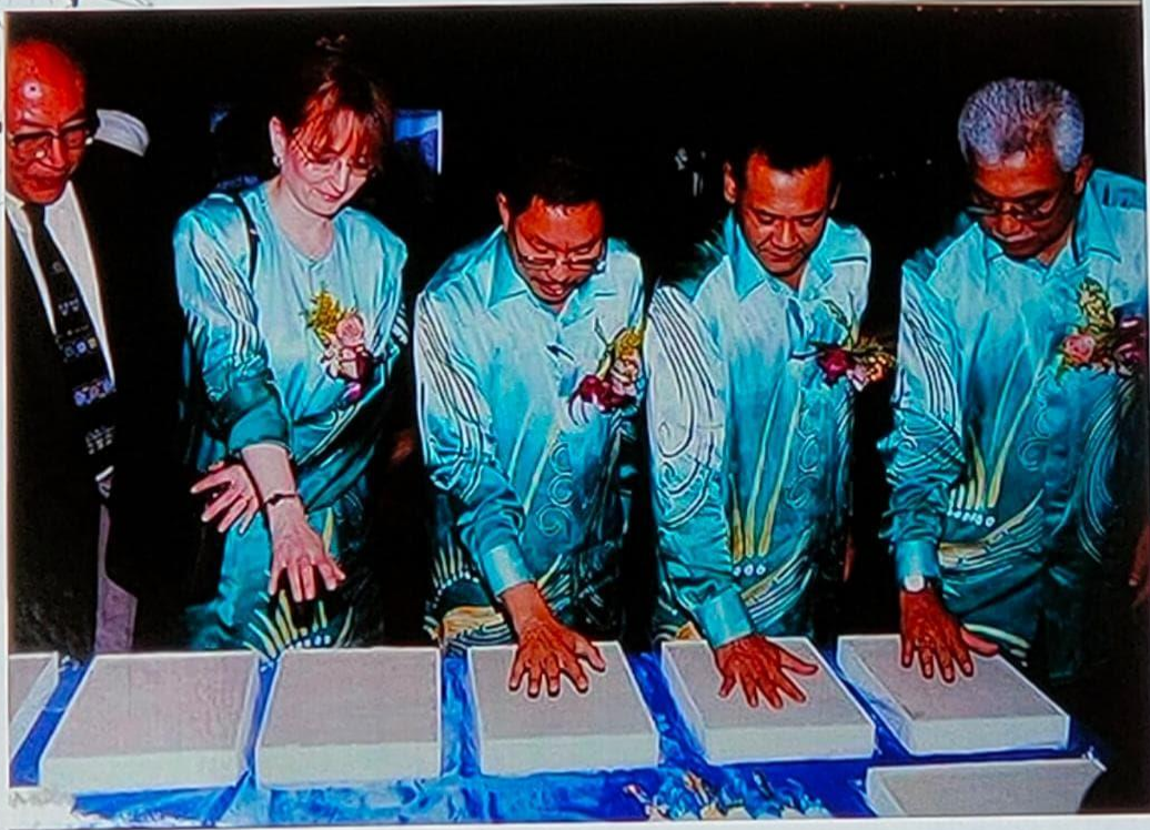
Pengisytiharan Langkawi sebagai global Geopark pertama di Asia Tenggara