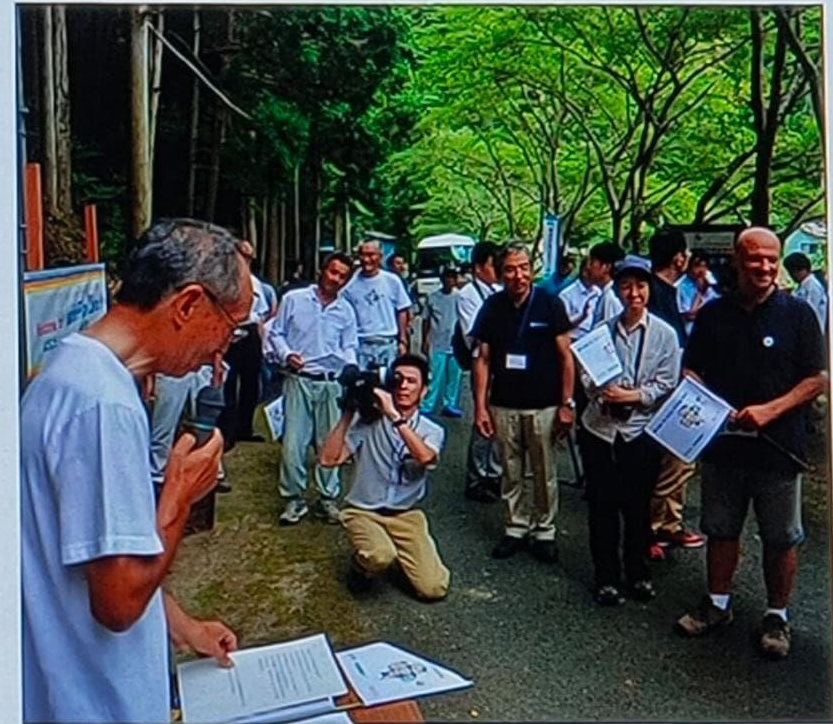
Ketua komuniti menyampaikan taklimat mengenai usaha pemuliharaan geowarisan, Jepun

Creative process of value to society, support by scientific/ experimental data which generates new institutional, social framework, profound changes in behaviour, attitudes, build alliances & empower the society