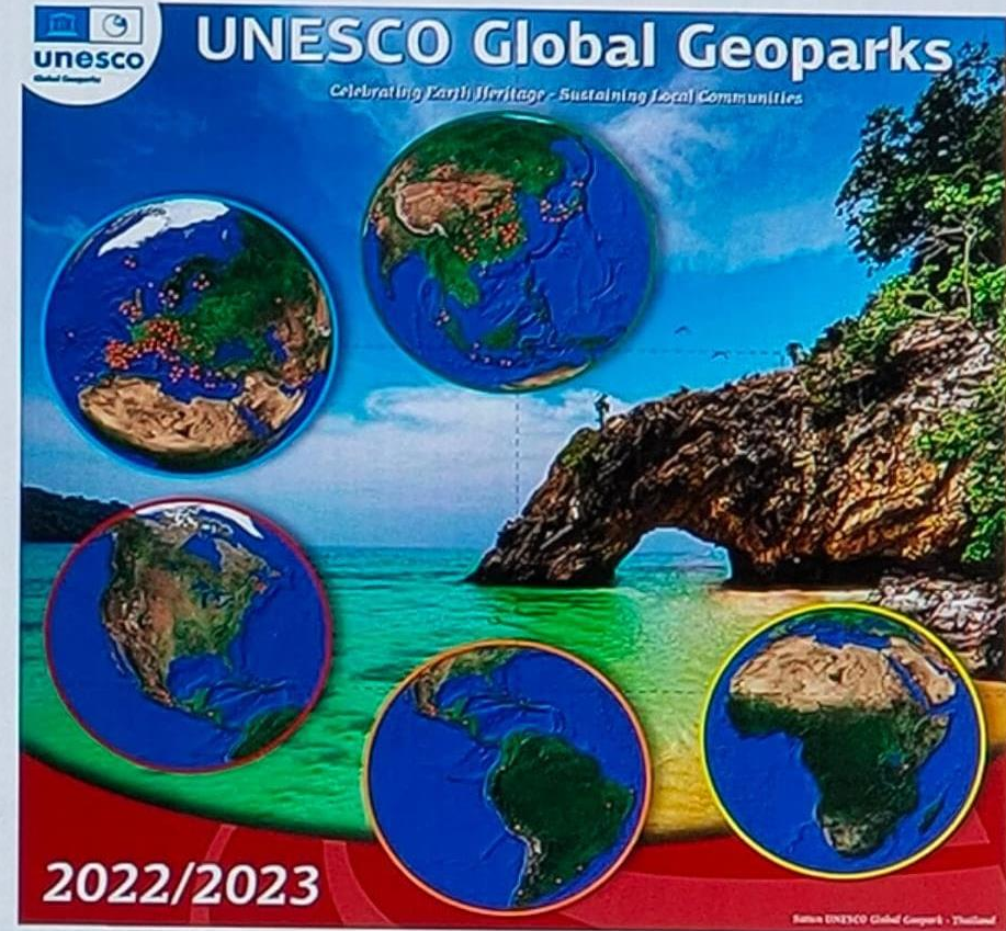
Taburan UNESCO Global Geopark di dunia