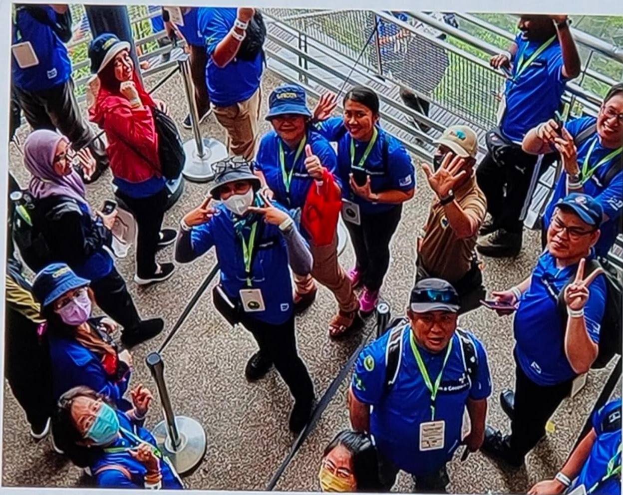
Bengkel Pembinaan Keupayaan di Langkawi UNESCO Global Geopark